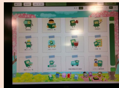
◀新しいOPAC画面 (図書館内用)