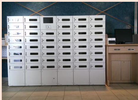
▲新しい予約ロッカー