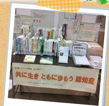
※写真は令和6年度の様子

認知症についての図書やパネルの展示、お持ち帰りいただけるチラシ等を設置しています。認知症に対する正しい知識を学び、理解を深めましょう。ぜひ、お立ち寄りください。