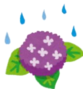
6月図書館カレンダー